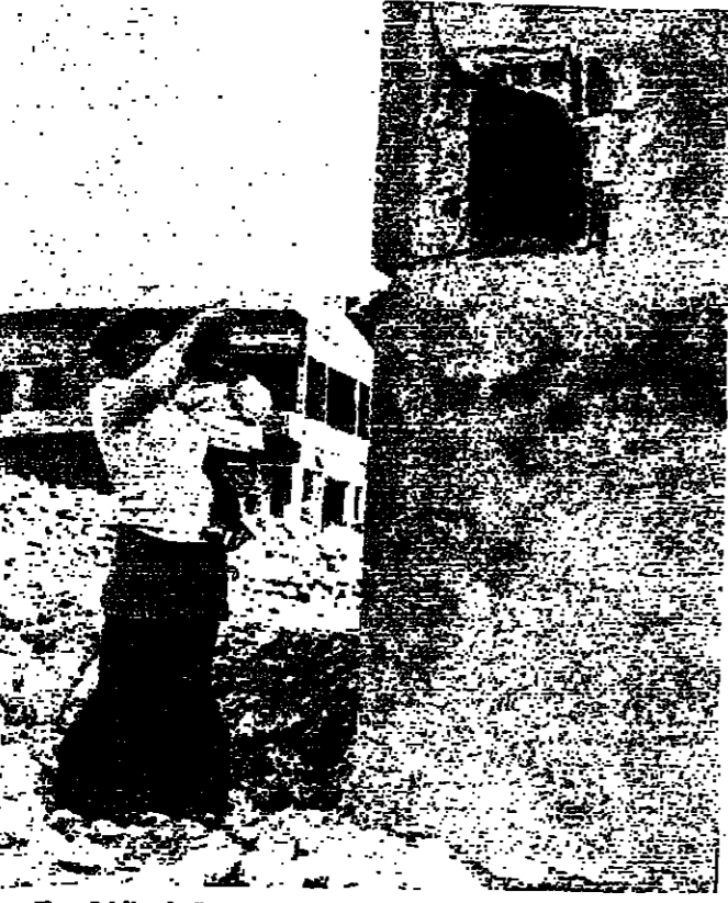
منظر منظر المهبط الذي اصيب بقذيفة اسرائيلية